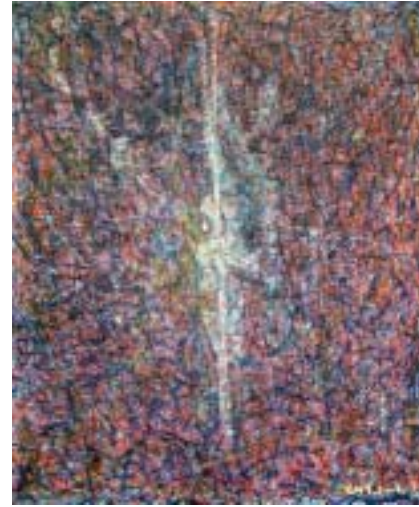
見方の問題 2004. 12, oil, canvas, F8