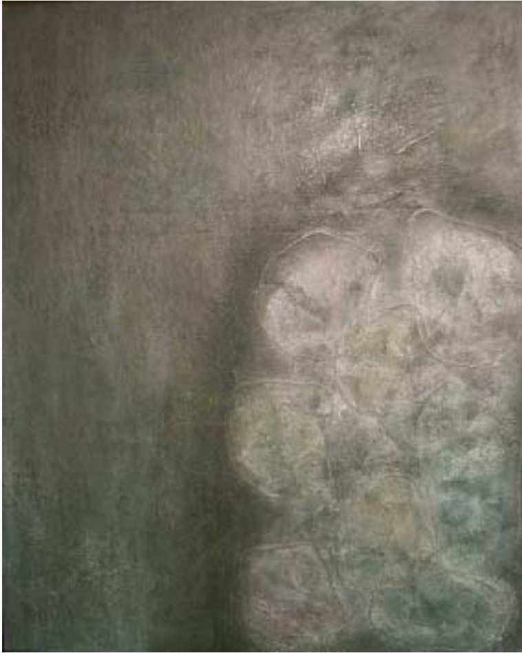
Super-string もしくは立ち上がる解放衝動 2005.2, oil, hemp string, canvas, F100(1303×1620mm)