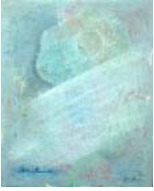
静止の中の速度 2004. 8, oil, canvas, F3