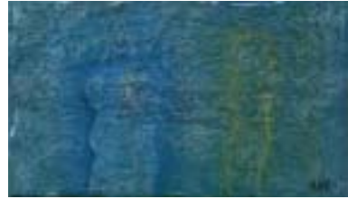
物質化された時間の幻想 2004. 10, oil, canvas, M4