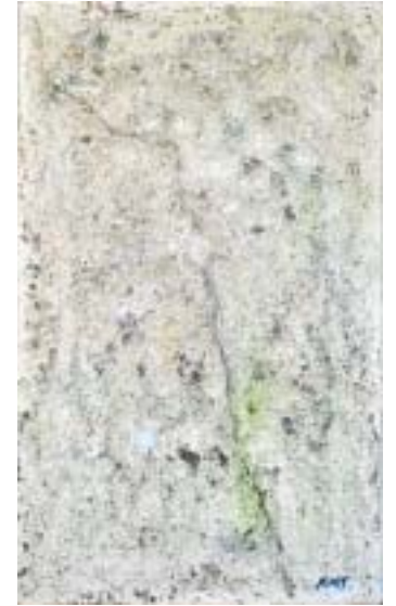
予告作品 次回個展のテーマ作品 2005. 4, oil, canvas, M6